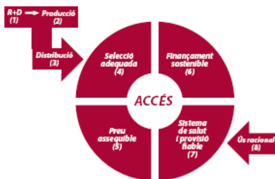
Figura 10. Factores que impiden el acceso a los medicamentos. OMS

Veamos pues cuáles son estos factores que impiden a las personas acceder a los medicamentos de calidad: