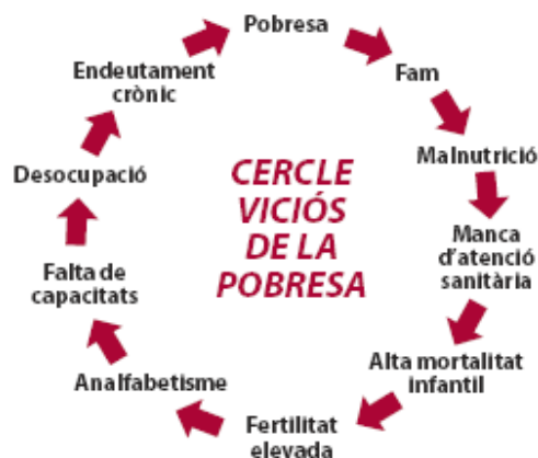
Figura 3. El círculo vicioso de la pobreza

En la siguiente figura quedan reflejadas algunas de las asociaciones mencionadas en el caso de la malaria, pero que son extensibles para cualquier enfermedad. En general recogen conexiones entre las necesidades humanas básicas y la ausencia de capacidades, libertades y derechos de las personas que pueden degenerar en pobreza. A su vez muestra cómo la pobreza provoca necesidades, disminuye las capacidades y limita las libertades y los derechos.